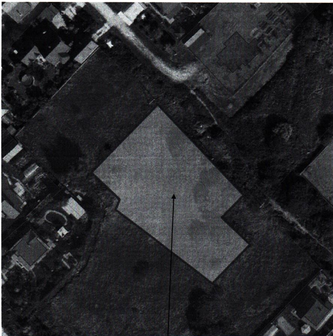
Обследуемый участок с КН 50:26:0100206:1265